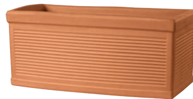
Cassetta MILLERIGHE cotto