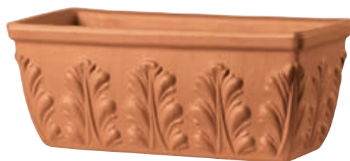
Cassetta ROMA cotto