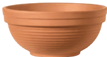
Ciotola GIGANTE cotto