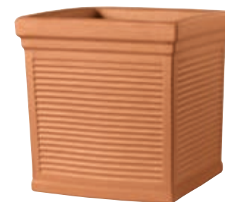
Quadro MILLERIGHE cotto