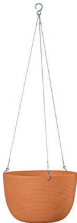
Ciotola AMERICA Sospesa cotto