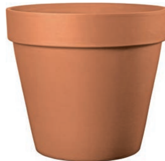
Vaso MAGNO cotto