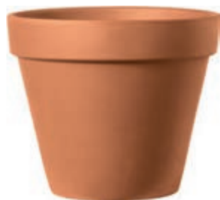
Vaso STANDARD cotto