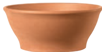
Ciotola LISCIA cotto