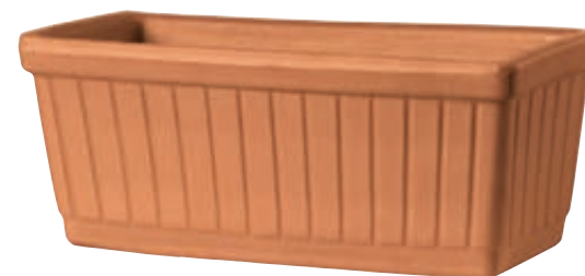
Cassetta VENEZIA cotto