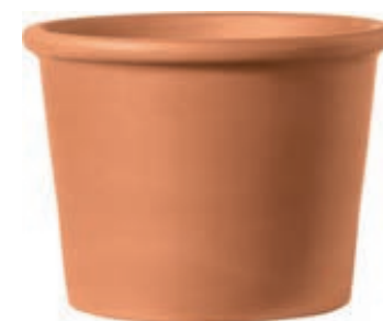
Cilindro BORDATO cotto