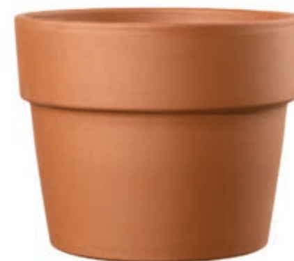
Vaso PERFETTO cotto

perfectly suitable to the pots of the best nurseries