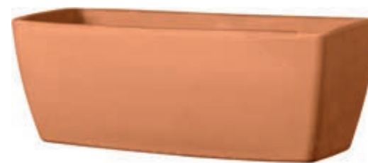
Cassetta GARDA cotto