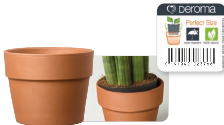
Cachepot Perfetto cotto