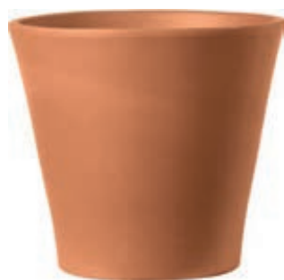
Vaso CONO cotto