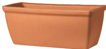
Cassetta ROMA LISCIA cotto