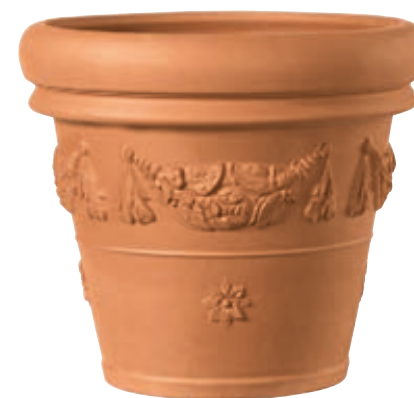
Vaso FESTONATO CLASSICO cotto