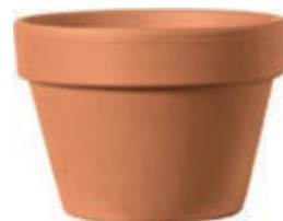
MEZZO Vaso cotto