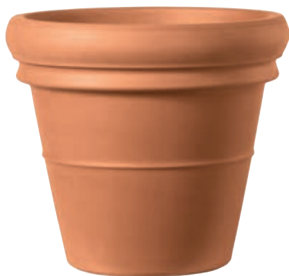
Vaso DOPPIO BORDO cotto