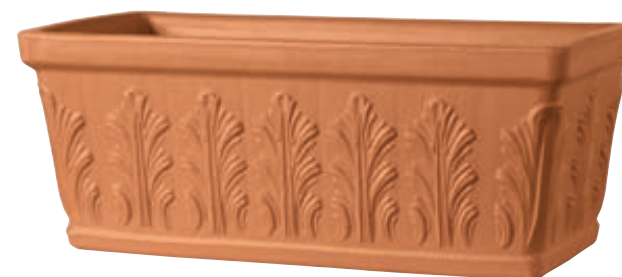
Cassetta SIENA cotto