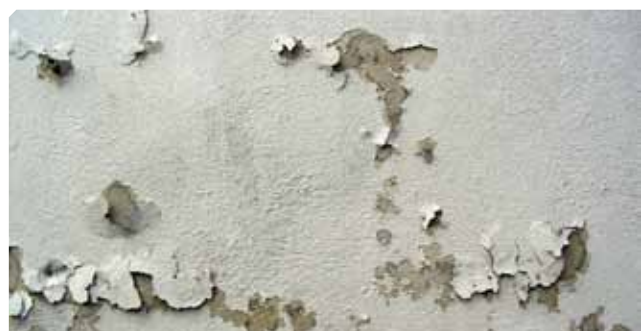
■ Vecchio fondo mal aderito