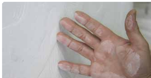
■ Supporto polveroso