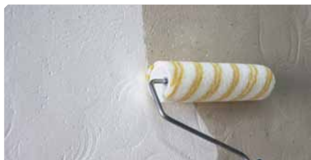
■ Imprimitura del supporto con il consolidante all'alcool