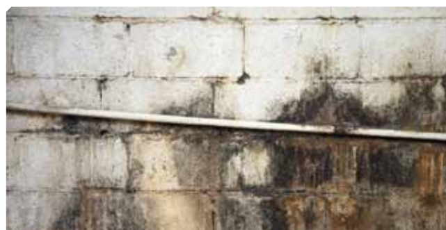
■ Umidità e microrganismi sopra il supporto