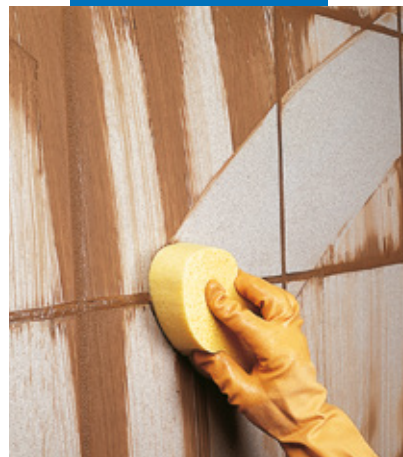
Finitura di parete con spugna

Le informazioni e le prescrizioni sopra riportate, pur corrispondendo alla nostra migliore esperienza, sono da ritenersi, in ogni caso, puramente indicative e dovranno essere confermate da esaurienti applicazioni pratiche; pertanto, prima di adoperare il prodotto, chi intenda farne uso è tenuto a stabilire se esso sia o meno adatto all'impiego previsto e, comunque, si assume ogni responsabilità che possa derivare dal suo uso.