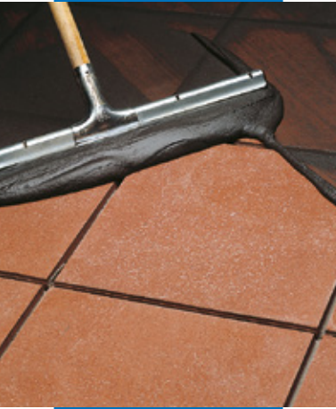
Stuccatura di pavimento in cotto con racla