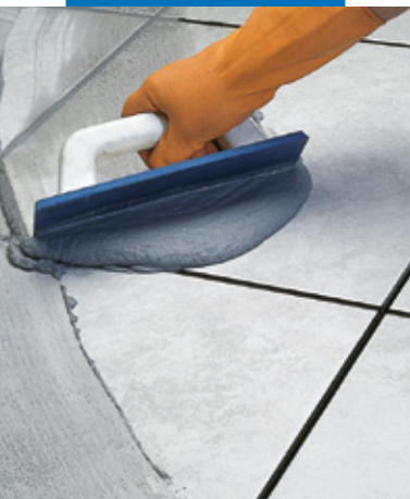
Stuccatura di pavimento ceramico con spatola in gomma