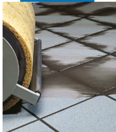
Finitura a pavimento con macchina