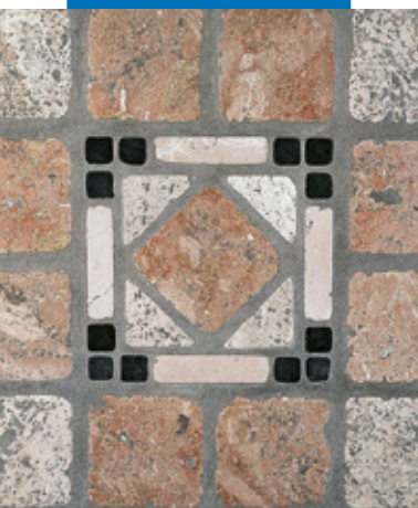
Esempio di stuccatura di pavimento anticato in pietra naturale

Le referenze relative a questo prodotto sono disponibili su richiesta e sul sito Mapei www.mapei.it e www.mapei.com